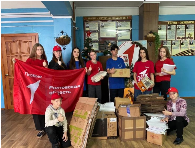
Акция «Новогодний подарок солдату»

Средства, вырученные за счет сдачи макулатуры, будут направлены на помощь для бойцов специальной военной операции.